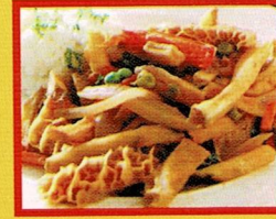
MONDONGUITO A LA ITALIANA