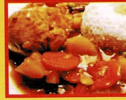
ESTOFADO DE POLLO