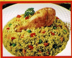
ARROZ CON POLLO