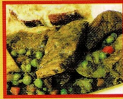
SECO DE CARNE