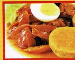
ESCABECHE DE PESCADO