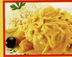
AJI DE GALLINA